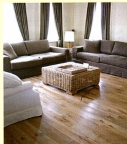
Parquet en chêne nouveau, contrecollé deux plis, huilé blanc avec lames très larges à chanfrein (20 x 180 x 2500 mm), autour de 180 € TTC le m 2 (Emois & bois).

Si la société SEAP développe des solutions écologiques concernant les systèmes de chauffage et de climatisation réversibles ou de production d'eau chaude solaire ; elle ne prescrit pas encore de matériaux pour les revêtements de sols, considérés comme "bio" ou inscrits dans le développement durable, par manque d'informations réelles.