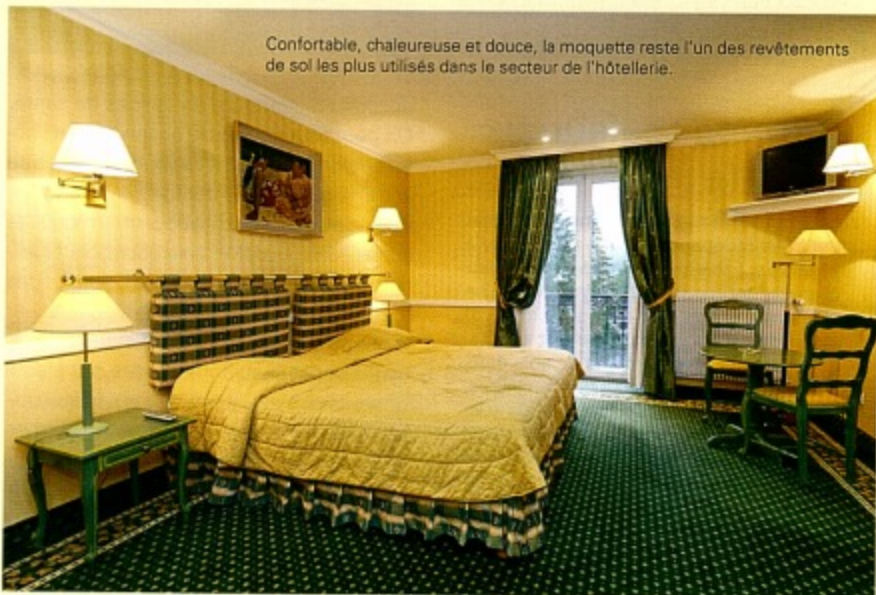
Document Benoit Fauch

Éléphants et variés, les revêtements de sols rivalisent de promesses. Mais par delà l'offre pléthorique (moquettes, revêtements plastiques, parquets, carrelage), il n'est pas toujours facile de s'y retrouver. Les matières jouent un rôle prépondérant comme repères émotionnels. Le sol – par sa présence, sa couleur, sa matière – contribue pleinement à l'atmosphère. Composante privilégiée de l'identité visuelle, il constitue l'une des bases de la réflexion des concepts d'agencement et entre dans les cahiers des charges définissant les matériaux, les matières et les couleurs des enseignes. Aussi, industriels, designers ou architectes s'associent-ils pour mettre en scène ces matières sous l'angle du renouveau, de la modernité,