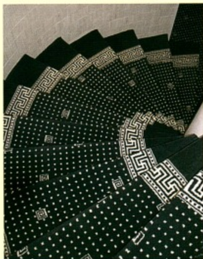
Avec des motifs classiques ou contemporains, les moquettes habillent et décorent aussi bien les chambres que les parties communes de votre établissement. (Moquette Tesri)