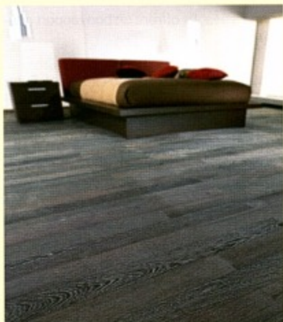
Essence exotique avec ce wengé contrecollé 3 plis huilé, décapé blanc (15 x 200 x 2500 mm), autour de 180 € TTC le m 2 (Emois & bois).

fier du naturel au plus sophistiqué. Esthétique, chaleureux et très isolant, le bois – matériau naturel par excellence – est un revêtement "durable". En effet, il permet de stocker le gaz carbonique contenu dans l'atmosphère et contribue ainsi à limiter l'effet de serre.